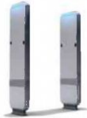
RFID Security Gate