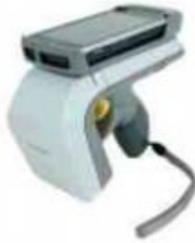
Hand Held RFID Terminal